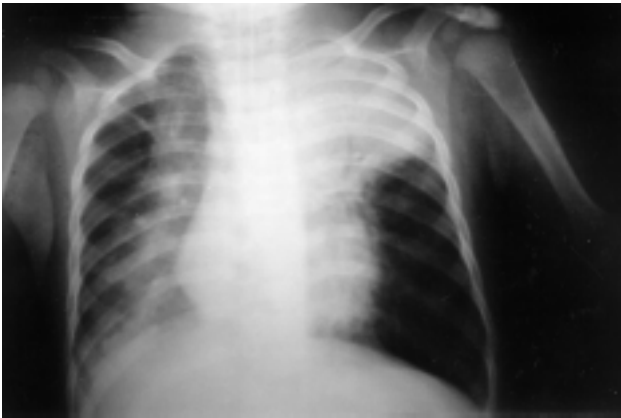
Figura 1 - Radiografia de tórax após intubação orotraqueal no primeiro dia de internação, notando-se comprometimento broncopneumônico bilateral com condensação pneumônica em ápice esquerdo

Criança de oito meses, sexo masculino, cor branca, procedente de São Paulo, com história de dois dias de tosse, febre e dispnéia progressiva, foi admitida no Instituto da Criança do Hospital das Clínicas da Faculdade de Medicina da Universidade de São Paulo em mau estado geral, gemente, normotérmico, descorado duas em quatro cruzes, taquipnéico, taquicárdico, com dispnéia intensa e estertores crepitantes em hemitórax esquerdo. A radiografia de tórax confirmou condensação em ápice esquerdo (Figura 1).