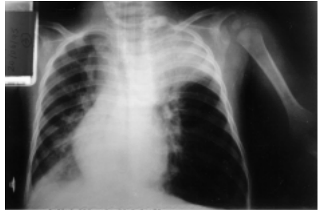
Figura 2 - Radiografia de tórax no segundo dia de internação, notando-se acentuada hiperinsuflação pulmonar à esquerda com desvio contralateral do mediastino

Devido à insuficiência respiratória, o paciente foi intubado por via orotraqueal com cânula siliconizada sem "cuff" 4,0 F e submetido à ventilação mecânica convencional com aparelho da marca Newport e umidificador aquecedor Fisher-Paikel a 33 graus centígrados. Foram introduzidos oxacilina e cloranfenicol. Foi mantido inicialmente com fração inspiratória de O_2 ( FiO_2 ) máxima de 50%, pressão inspiratória máxima (PIP) de 25cm H_2O , em ventilação mandatória intermitente (IMV) com frequência respiratória entre 30 e 50 r/min. e pressão expiratória final positiva (PEEP) 4cm H_2O . No segundo dia de internação apresentou diminuição súbita da expansibilidade torácica, hipercapnia ( PaCO_2 máxima de 219mmHg), hipoxemia e hiperinsuflação pulmonar, à radiografia de tórax, mais acentuada à esquerda, com desvio de mediastino contralateral (Figura 2). Submetido à broncoscopia de urgência, foi diagnosticada traqueobronquite necrotizante. A mucosa traqueobrônquica estava intensamente hiperemiada e sangrante ao toque do aparelho endoscópico, e havia suboclusão de traquéia distal e brônquios principais por crostas. Estas foram removidas com aspirador e pinça de corpo estranho. A criança evoluiu com melhora progressiva, sendo extubada no décimo dia de internação. Recebeu alta hospitalar no vigésimo dia de internação.