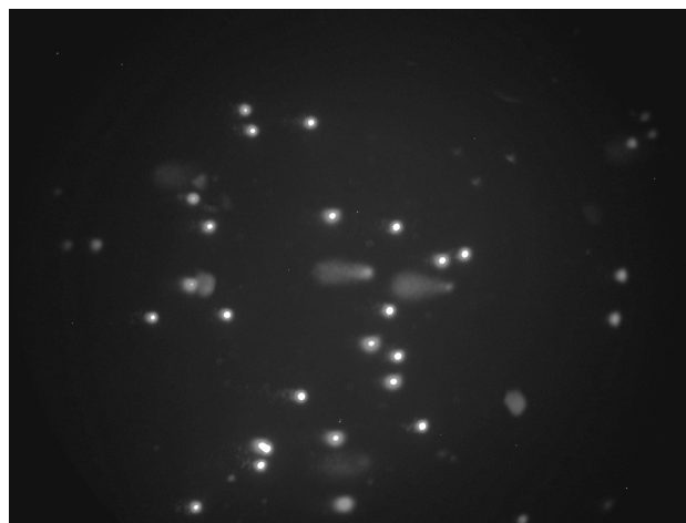
Figura 2 - Fotomicrografia de amostra representativa induzindo danos ao DNA em recém-nascido tratado com fototerapia intensiva. As células foram processadas por eletroforese alcalina em gel de célula única. Leucócitos mononucleares de sangue periférico expostos a fototerapia exibem caudas de cometa indicando danos ao DNA

Níveis de CAT e EOT foram medidos pelos métodos de Erel 15,16 . A porcentagem de nível de EOT em relação a nível de CAT foi considerada como sendo IEO 17,18 . Para realizar o cálculo, a unidade de resultado de CAT, mmol equivalente de Trolox/L, foi alterada para \mu\text{mol} equivalente de Trolox/L, e o valor do IEO foi calculado da seguinte forma: \text{IEO} = [(\text{EOT}, \mu\text{mol/L}) / (\text{CAT}, \mu\text{mol equivalente de Trolox/L}) / 100] .