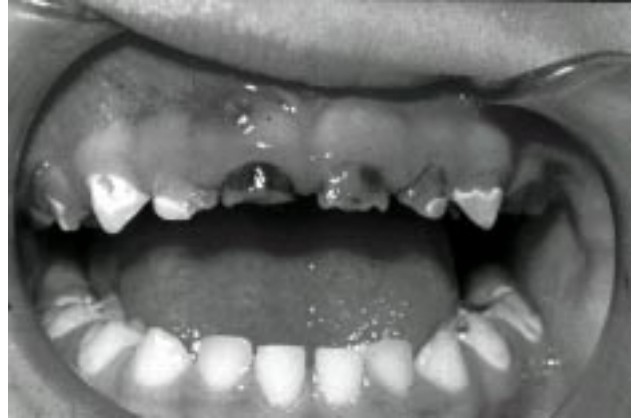
Figura 1 - Padrão típico de cárie do lactente e do pré-escolar acometendo extensamente os dentes superiores e molares inferiores, sem afetar os dentes ântero-inferiores. Presença de abscesso em incisivo central superior direito decíduo.

A CLPE é uma doença mais comumente encontrada em crianças que vivem na pobreza ou em condições de carência econômica 7,11,24-26,33-37 , que fazem parte de minorias étnicas e raciais 12,38 , filhos de mães solteiras 39 e de pais com menor escolaridade, em especial de mães analfabetas 7,26,28,33,37,39,40 . Nessa população, a má nutrição ou a subnutrição pré- e perinatal são causas de hipoplasia do esmalte, a higiene oral normalmente é deficiente, provavelmente a exposição ao flúor é insuficiente 12,39 , e há maior preferência por alimentos com açúcar 36,41 .