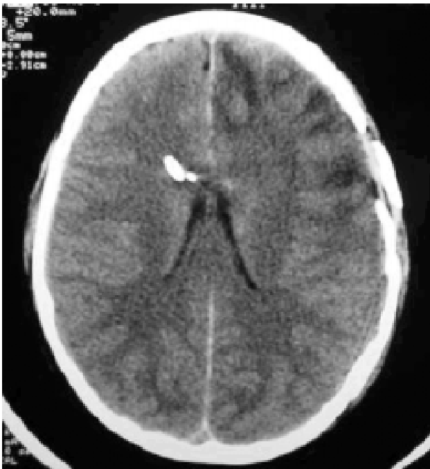
Figura 1 - TC de crânio mostrando monitorização da PIC com cateter de drenagem ventricular associado a eletrodo com transdutor na ponta, em paciente com TCE grave, múltiplas fraturas de crânio e contusão frontal

A ressonância magnética cerebral (RM) não acrescenta dados para a indicação de tratamento cirúrgico; no entanto, mostra significativa correlação entre extensão da lesão e prognóstico cognitivo, e é freqüentemente indicada para avaliação da extensão da lesão cerebral e do tronco cerebral 10 .