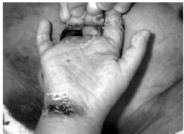
Figura 1 - Lesões ulcerocrostosas nas mãos

Durante a internação, os níveis de hemoglobina variaram de 5,3 a 11,1g/dl. O número de leucócitos totais variou de 9.200 a 12.300/mm 3 , com predomínio de neutrófilos.