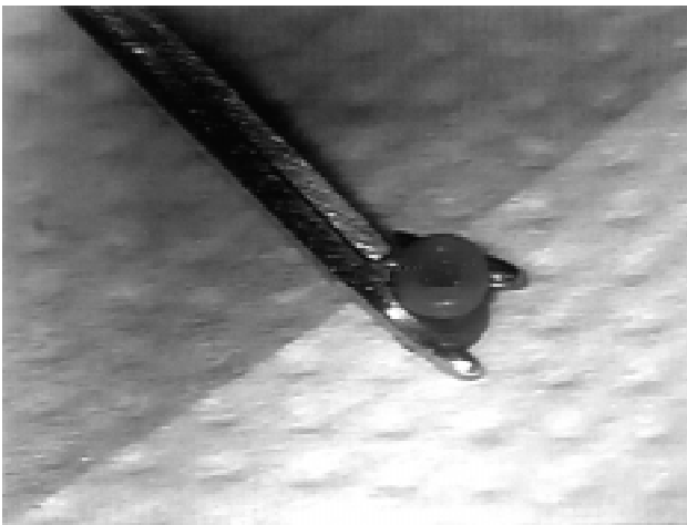
Figura 1 - Tubo de ventilação tipo Donaldson apoiado em micropinça otológica

Foi criado um modelo de coluna de água em um recipiente transparente, graduado em centímetros, com altura medida a partir da base. Na sua porção inferior, foram adaptados sucessivamente três tipos de TVs mais comumente utilizados, Donaldson (Figuras 1 e 2), Armstrong e Bobbin, todos com diâmetro interno de 1,14mm. O TV tipo Armstrong apresenta comprimento de 7,0mm, enquanto que os outros, 4,5mm. Em cada um dos modelos foi colocada água da torneira a 16 °C e 28 °C, água do mar, água da piscina, água do rio, gota otológica (Sulfato de Polimixina B + Cloridrato de Lidocaína) e água da torneira com sabão. Utilizando os vários tipos de líquidos, a experiência constituiu em preencher o recipiente com microgotas, colocadas sucessivamente, de maneira a formar uma coluna líquida até ocorrer seu escape, fluindo através do orifício do TV. Neste momento, anotava-se a altura da coluna de água em que isso ocorria. O teste foi repetido dez vezes para obter-se os limiares equivalentes à pressão em centímetro de água