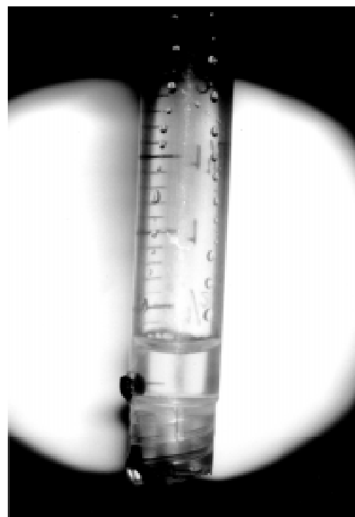
Figura 4 - Coluna graduada com tubo de Donaldson e água com sabão, com pressão de 0,6\text{cmH}_2\text{O} , no momento da passagem do líquido através do orifício

Nossos resultados corroboram a observação de que existe uma resistência natural à passagem para diferentes tipos de líquidos, semelhantes entre si, e comprovada experimentalmente, que é possível de observar nas médias e variações encontradas para água da torneira, da piscina e do mar. Verificamos que os resultados não se alteravam com variação da temperatura do fluido. Esta resistência diminui progressivamente com os respectivos tipos de líquidos: água do rio, gota otológica e água com sabão. Isso pode ser explicado pela ação de substâncias emulsificantes, por exemplo, sabão, o qual diminui a tensão superficial, facilitando a passagem do líquido com menor nível de pressão. Embora não tenha sido feita análise da composição da água do rio, os autores levantam a hipótese da existência de algum poluente com ação detergente, que possa diminuir a tensão superficial do líquido.