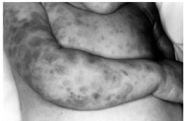
Figura 3 - Caso 3: mastocitose sistêmica - pápulas eritematosas com sinal de Darier positivo, na face, membros superiores e inferiores

A mastocitose cutânea difusa é uma variedade rara e consiste de uma infiltração difusa da pele com mastócitos, podendo ter lesões isoladas. Usualmente todo o tegumento está envolvido, manifestando-se através de um espessamento difuso, de consistência empastada, semelhante ao